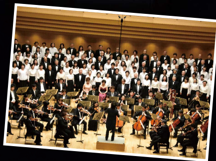
2017.4.1「がん患者さんが歌う春の第九」

チケットお申し込み方法 以下のいずれかの方法でお申し込みください。(2018年9月4日10時より発売開始)