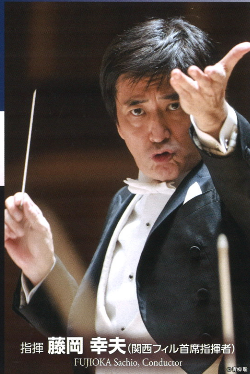
指揮 藤岡 幸夫 (関西フィル首席指揮者) FUJIOKA Sachio, Conductor

62年生まれ。BBCフィル、マンチェスター室内管、日本フィルのポストを歴任。06年「ねじの回転」でスペイン・オペラにデビュー、ベスト・パフォーマンス賞。09年「ナクソス島のアリアドネ」で再び大成功。00年関西フィル正指揮者、07年同首席指揮者就任。渡邊暁雄氏最後の愛弟子。02年度渡邊暁雄音楽基金音楽賞受賞。 公式ファンサイト http://www.fujioka-sachio.com/ Twitterアカウント @sacchyo0608