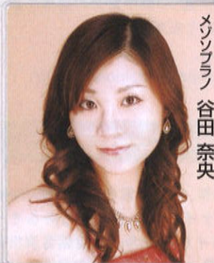
メゾソプラノ 谷田奈央